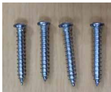
●壁面固定用ネジ 4コ