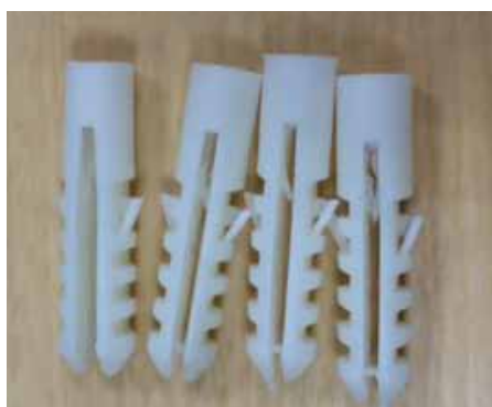
●ドリル穴に入れるビス 4コ