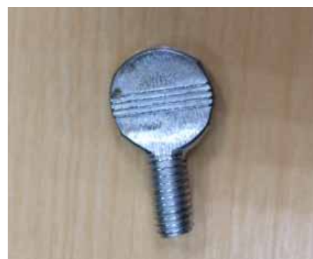
●ポール固定用ネジ 1コ